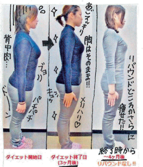
ダイエット開始日 → ダイエット終了日 (3ヶ月後) → 終了時から~4ヶ月後 リバウンドなし!!

自宅耳つぼダイエットサロン Seaprove (シ-ブローリ-) 〒747-0005 山口県防府市中西1-20 TEL 070-5531-3428