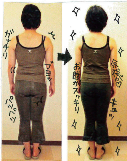
(T様) 身長153cm 41歳

体重 58.9kg → 50.6kg (-8.3kg) ウエスト 83cm → 71cm (-12cm) BMI 24.2 → 20.7 (-3.5)